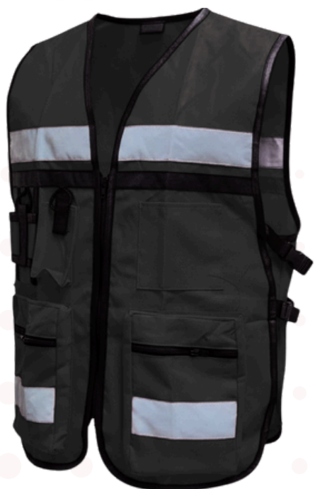
IMAGEN DESCRIPTIVA, DETALLES PUEDEN VARIAR