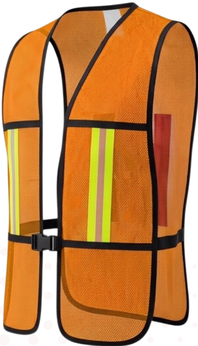
IMAGEN DESCRIPTIVA, DETALLES PUEDEN VARIAR